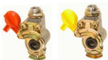
CONNECTION DES 2 CONDUITES DE FREINAGE PNEUMATIQUES.

Ceci s'impose aussi bien pour les architectures de freinage pneumatique qu'hydraulique.